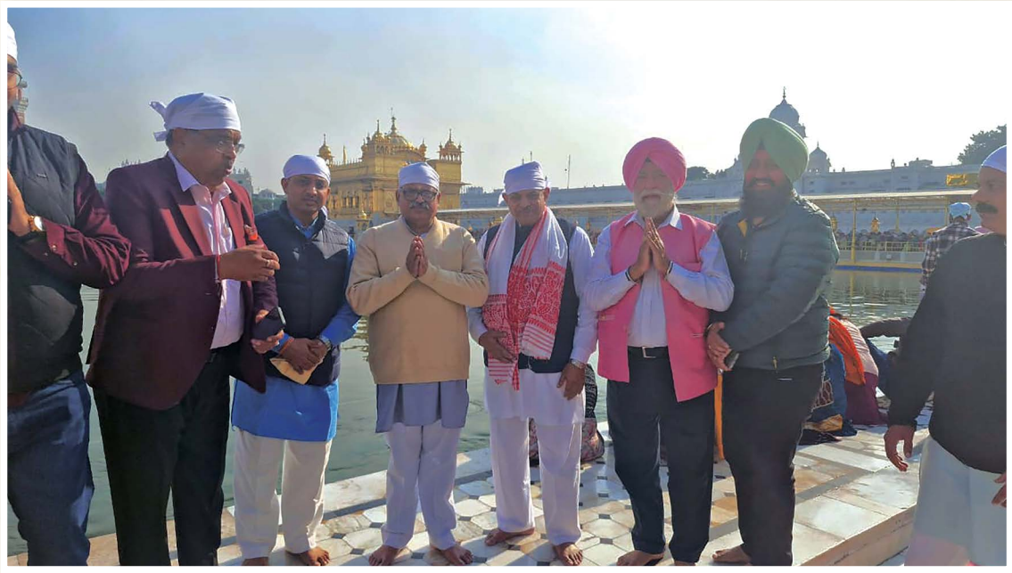
अमृतसर में हरमंदिर साहिब में माथा टेकने के बाद परिक्रमा किये