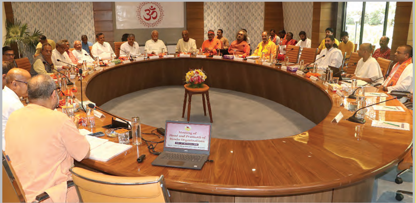
हिंदू समाज के विविध विश्वविख्यात संगठनों के प्रमुखों की बैठक, मुंबई, जनवरी 2025 में पू. सरसंघचालक जी व अन्य प्रमुख