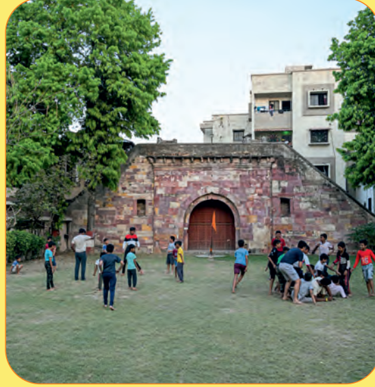
मोहिते विद्यार्थी शाखा, नागपुर