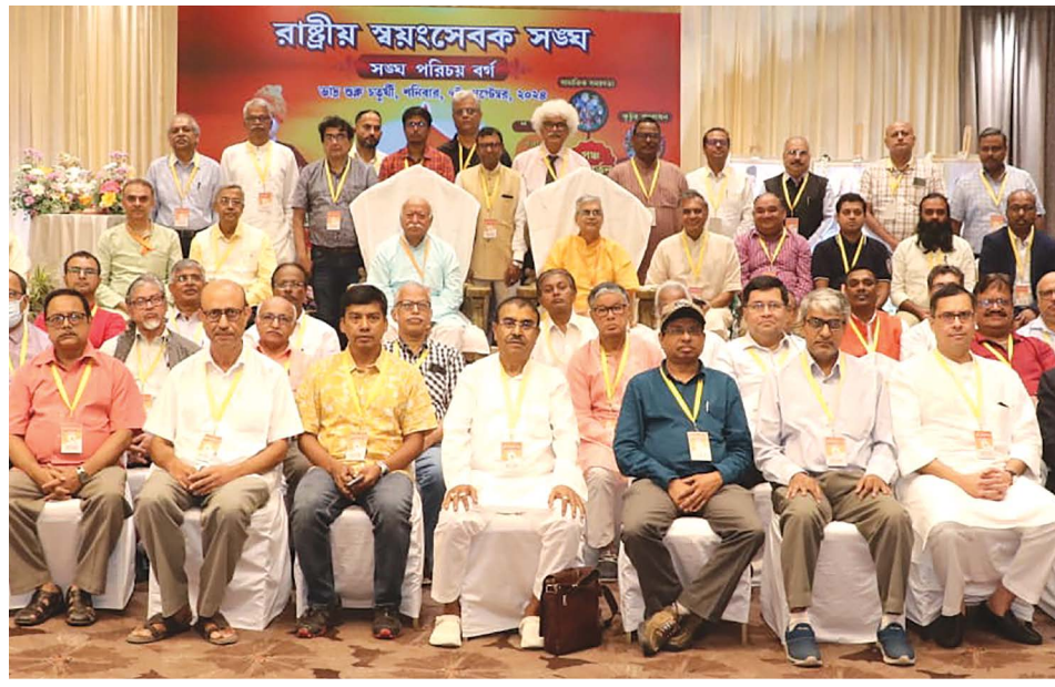
संघ परिचय वर्ग, कोलकाता

हिमाचल – गत वर्ष श्रीराम जन्मभूमि मन्दिर प्राण प्रतिष्ठा के प्रसंग पर प्रान्त में व्यापक जन संपर्क अभियान चलाया था । इनके अनुवर्तन में जागरण श्रेणी द्वारा सम्पर्कित व्यक्तियों के लिए संघ परिचय वर्गों की योजना बनी । 95 संघ परिचय वर्ग में 3195 समाज बन्धु उपस्थित रहे ।