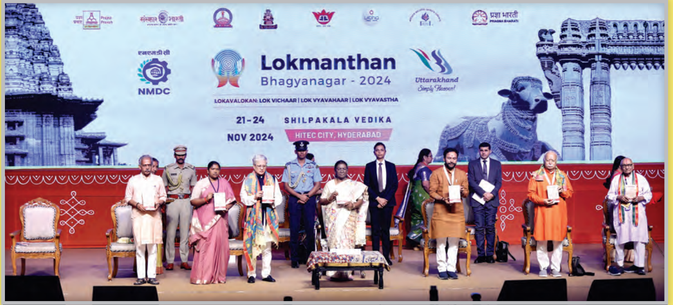
लोक मंथन कार्यक्रम में आदरणीया राष्ट्रपति श्रीमती द्रौपदी मुर्मु जी, पू. सरसंघचालक जी एवं अन्य महानुभव