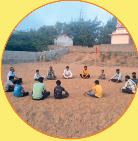
विद्यार्थी शाखा ग्राम-कपुराशी, जिला-कच्छ

शाखा में हम ऐसे खेले जिससे प्रेम उमडता हो कुछ बौद्धिक हो गीत गान हो धर्म ज्ञान की चर्चा हो भगवा ध्वज हो नित्य सामने त्याग भावना पलती है ॥