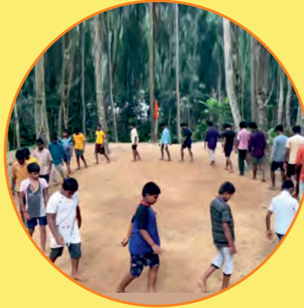
विद्यार्थी शाखा ग्राम-कावुथिट्टे, जिला-कन्याकुमारी

100 वर्ष पूर्व पू. डॉ. हेडगेवार जी ने यह संस्कार साधना प्रारंभ की थी । आज देश के कोने-कोने में यह साधना अखंड चल रही है ।