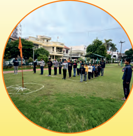
विद्यार्थी शाखा, जम्मू

मंत्र छोटा रीत नई आसान हमने पाई है छोटे छोटे संस्कारों से बात बडी बन जाती है ॥