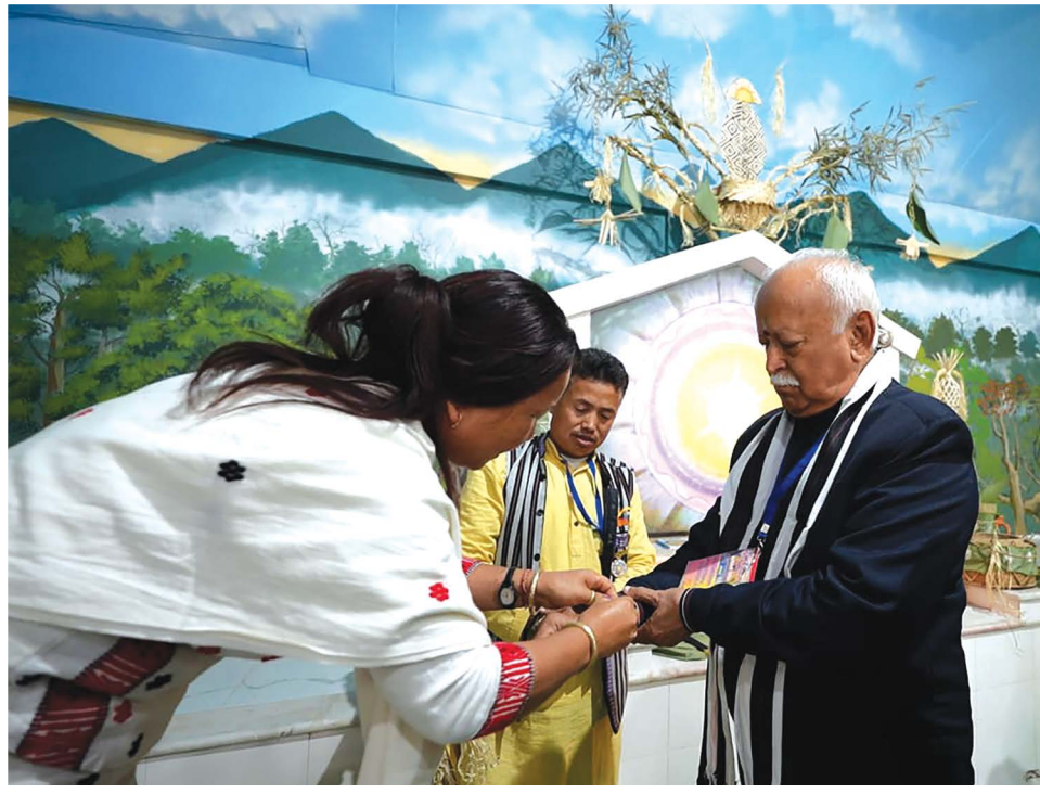
दोन्यी-पोलो मंदिर, नाहरलगुन, अरुणाचल प्रदेश में पू. सरसंघचालक जी