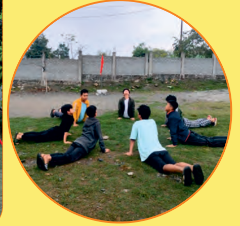
विद्यार्थी शाखा रोइंग, अरुणाचल प्रदेश